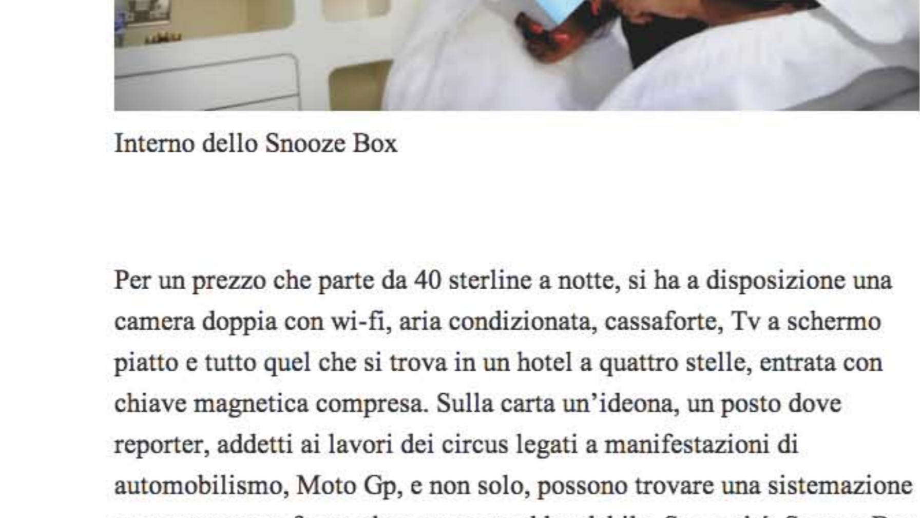
Interno dello Snooze Box

Per un prezzo che parte da 40 sterline a notte, si ha a disposizione una camera doppia con wi-fi, aria condizionata, cassaforte, Tvs a schermo piatto e tutto quel che si trova in un hotel a quattro stelle, entrata e cambio magnetica compresa. Sulla carta un'idea, un posto dove reporter, addetti ai lavori dei circus legati a manifestazioni di automobilismo, Moto Gp, e non solo, possono trovare una sistemazione temporanea confortevole e a un costo abbordabile. Senonché Snooze Box Plc, la holding che gestisce finanziariamente il progetto, non va molto bene in Borsa. Dal debutto, nel 2012, all'Alternative Investment Market di Londra, le azioni sono crollate dagli iniziali 40 pence per quota, agli attuali 9 pence. Segno che per quanto economico, ecologico (i box possono essere riutilizzati e riadattati) e innovativo, il container non fa più di tanto gola agli investitori. Probabilmente pensano che il lusso, quello vero, è un'altra cosa. Come dargli torto.