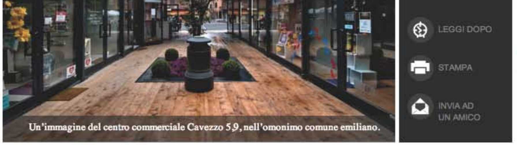
Un'immagine del centro commerciale Cavezzo 5,9, nell'omonimo comune emiliano.

Alberghi, centri commerciali, rifugi per senza tetto. Il boom dei container (non solo per le merci) Federico Guertini