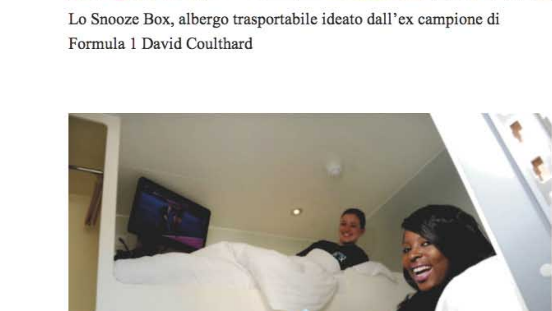
Lo Snooze Box, albergo trasportabile ideato dall'ex campione di Formula 1 David Coulthard

Per quanto chic e all'ultima moda, Box Park non è niente in confronto a Snooze Box, un po' il progenitore di tutti questi progetti che contemplan un uso alternativo dei contenitori abitualmente adoperati per le spedizioni di merci. Nientemeno che un hotel di lusso, partorito dalla fantasia e dalla voglia imprenditoriale dell'ex pilota di Formula 1 David Coulthard. Lanciato nel luglio 2011 in occasione del Gran Premio di Silverstone, Snooze Box funziona come un "albergo viaggiante", che viene montato in concomitanza con grandi eventi (per lo più legati al mondo dei motori).