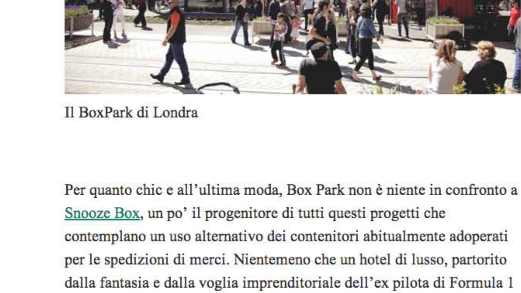
Il BoxPark di Londra

Per quanto chic e all'ultima moda, Box Park non è niente in confronto a Snooze Box, un po' il progenitore di tutti questi progetti che contemplan un uso alternativo dei contenitori abitualmente adoperati per le spedizioni di merci. Nientemeno che un hotel di lusso, partorito dalla fantasia e dalla voglia imprenditoriale dell'ex pilota di Formula 1 David Coulthard. Lanciato nel luglio 2011 in occasione del Gran Premio di Silverstone, Snooze Box funziona come un "albergo viaggiante", che viene montato in concomitanza con grandi eventi (per lo più legati al mondo dei motori).