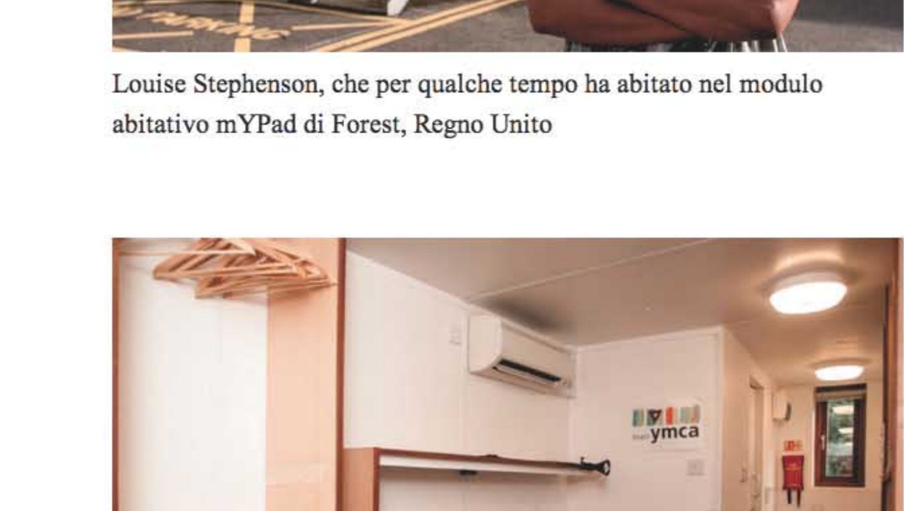
Interno del modulo abitativo mYPad

L'affitto sarà di 75 sterline la settimana, e all'interno dei container, per ciascuno dei quali l'associazione ha investito 32.000 sterline per renderli abitabili, c'è tutto il necessario per vivere, seppur in spazi un po' ristretti: un televisore, un forno a microonde, indispensabile per riscaldare i cibi precotti di cui abbondano i supermercati inglesi; letto, bagno e cucinino. Non sarà un reggia, ma di certo è un'iniziativa molto apprezzata, tanto che la Ong, una volta ottenuto il via libera per l'uso del suolo dove sistemare i primi due mYPad, è stata sommersa di richieste, non solo da parte di homeless. Per il momento tuttavia i container sono riservati agli ospiti dell'istituto, ma Pain non esclude che in futuro questo formato abitativo possa trovare un suo spazio all'interno del normale mondo immobiliare.