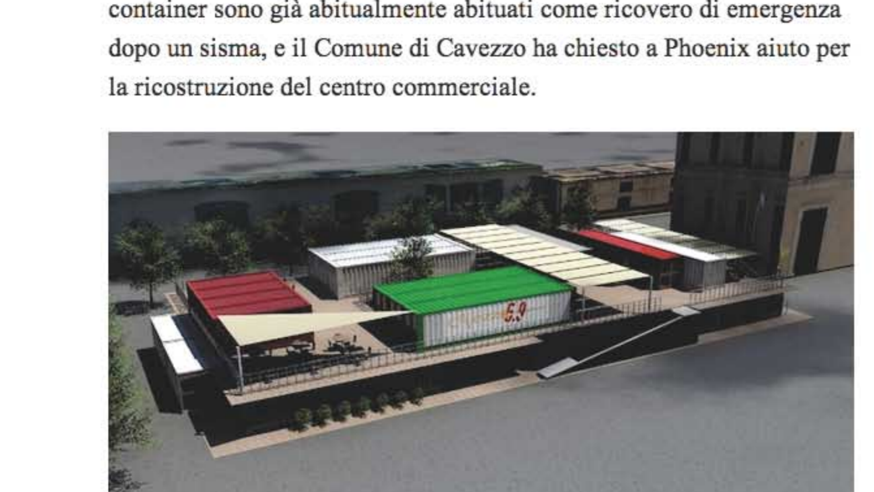
Rendering del progetto del centro commerciale Cavezzo 5,9

Si tratta di certo un po' di una scommessa, ma non tanto azzardata quanto si potrebbe pensare. Tanto che la stessa idea è venuta anche a un'azienda di Genova, la Phoenix International, che all'ultimo Salone internazionale dell'industrializzazione edilizia di Bologna, nell'ottobre scorso, ha presentato "Box4It", un progetto per riadattare container marittimi ormai a fine corsa, riciclarli, disinfestarli e trasformarli in moduli abitativi. L'idea è nata dopo il terremoto dell'Emilia Romagna, che ha distrutto case e negozi in vaste aree della provincia di Modena. I container sono già abitualmente abituati come ricovero di emergenza dopo un sisma, e il Comune di Cavezzo ha chiesto a Phoenix aiuto per la ricostruzione del centro commerciale.